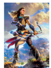
Horizon : Zéro Dawn - 1er jeu vidéo féministe.